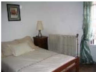
One of the double rooms with door to en-suite

Du village on accède facilement aux sentiers de randonnée qui sillonnent la montagne pour toutes