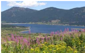
Lac Matemale en été

Tout comme pour une habitation spacieuse et confortable, nous avons essayé de prévoir tous vos besoins après une journée remplie d'activités. Nous fournissons le bois pour votre cheminée. Ainsi, chaque jour il ne vous reste plus que de penser à vous amuser, vous détendre et décider de vos projets du lendemain!