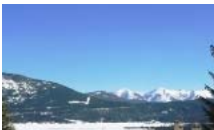
Vue du Balcon

Le chalet, offre des pièces sur plusieurs niveaux. En bas on trouve la cuisine, la salle de bains et les w.c., au niveau du milieu la pièce principale et plus haut les chambres à coucher avec mezzanine. Il y a deux chambres à coucher, une avec un lit double, l'autre avec un lit double et une couchette simple au-dessus.